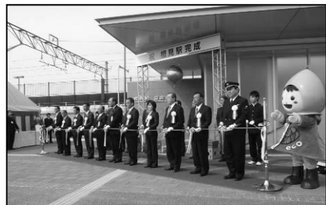
写真-6 相見駅開業式典の様子