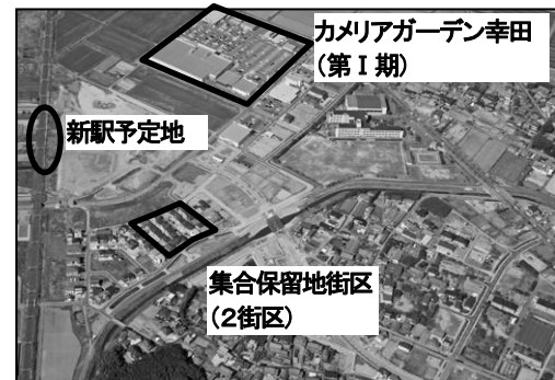
写真-1 平成18年の状況