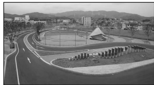
写真-4 完成後の東駅前広場