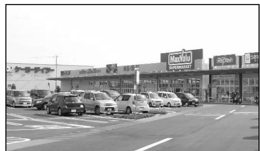
写真-3 大型商業施設