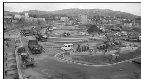
写真-5 工事中の東駅前広場 (H24. 1. 25)