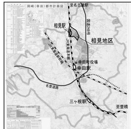
図-1 相見地区の位置