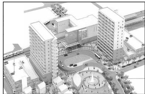
図-4 東駅前広場周辺の土地利用イメージ

しかし、平成19年からのJR東海との具体的な協議により、下り線に待避線を設け、名古屋方面への輸送力を高める2面3線<上りホーム1面+下りホーム(島式)1面・上り下り軌道2線+下り待避線1線>、お