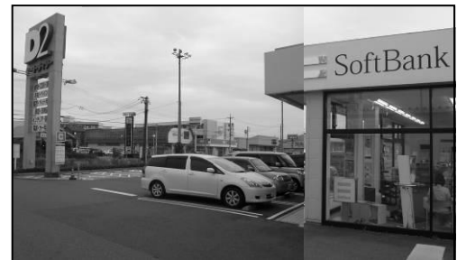
写真-2 相見線沿道の大手携帯電話会社